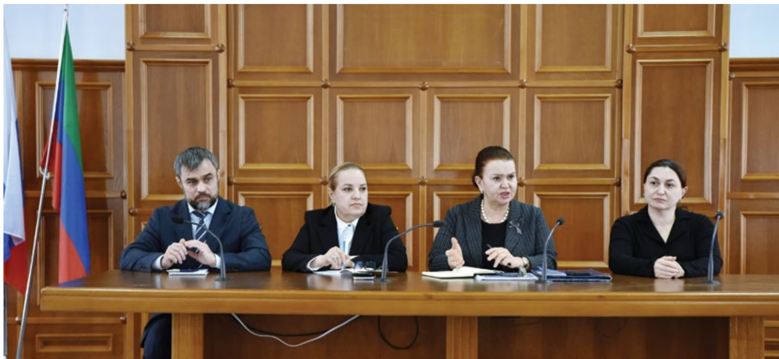
Участники встреч с трудовыми коллективами