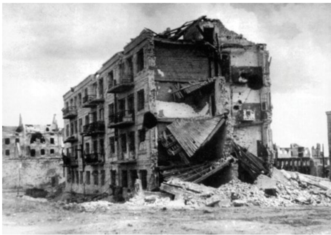
Дом Павлова – неприступная крепость

«То, что предстало перед нами 23 августа в Сталинграде, поразило как тяжелый кошмар. Беспрерывно то там, то здесь взмывали вверх огнедымные султаны бомбовых взрывов. Огромные столбы пламени поднялись к небу в районе нефтехранилищ. Потоки горящей нефти и бензина устремились к Волге. Горела река, горели пароходы на Сталинградском рейде. Смердно чадил асфальт улиц и площадей. Как спички, вспыхивали телеграфные столбы. Стоял невообразимый шум, надрывавший слух своей адской музыкой. Визг летящих с высоты бомб смешивался с гулом взрывов, скрежетом и лязгом рушившихся построек, треском бушевавшего огня. Стылали гибнувшие люди, надрывно плакали и взывали к помощи женщины и дети», – вспоминал потом командующий Сталинградским фронтом Андрей Еременко.