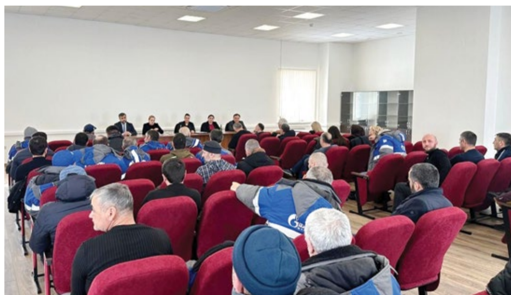
Кизилюртовское линейное производственное управление магистральных газопроводов