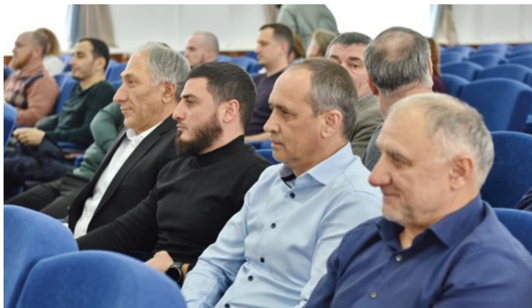
Зал заседаний административно-производственного комплекса «Степной»