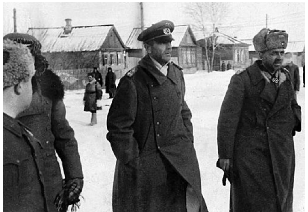
Пленение генерал-фельдмаршала Фридриха Паулюса

Советским командованием был разработан план операции по ликвидации немецких войск, получивший кодовое наименование «Кольцо». Проведение операции предусматривалось в три этапа: первый – отсечение и уничтожение противника в западной и северо-восточной частях района окружения; вто-