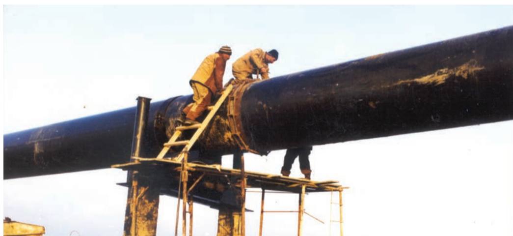
Монтаж воздушного перехода через реку Терек при строительстве технической перемычки Кумли – Аксай

2005 г. – ввод в эксплуатацию технологической перемычки между газопроводами «Магат – Северный Кавказ» и «Моздок – Казимагомед», протяженностью около 115 км. Перемычка проходит по маршруту Кумли – Кизляр – Бабаюрт – Аксай. Помимо трубопровода в систему перемычки входят узел редуцирования и узлы запуска и приема очистного поршня.