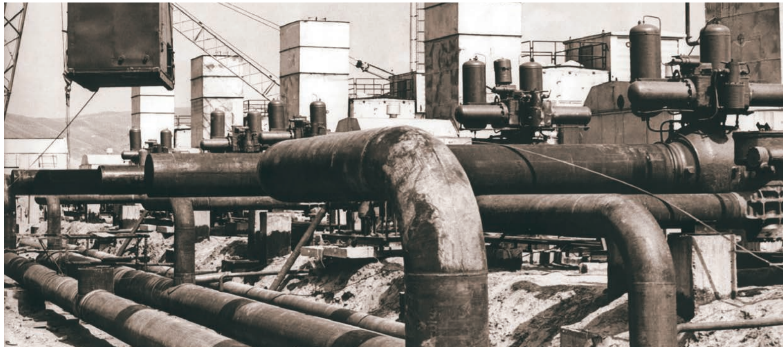
На 660 км магистрального газопровода «Моздок – Казимагомед» строится компрессорная станция «Избербаш» 1982 г.

1964 г. – постановлением Совета Министров ДАССР создается республиканский трест газового хозяйства «Даггаз», затем создаются газовые хозяйства в Дербенте и Избербаше, и постепенно голубое топливо начинает повсеместно входить в жизнь и быт населения.