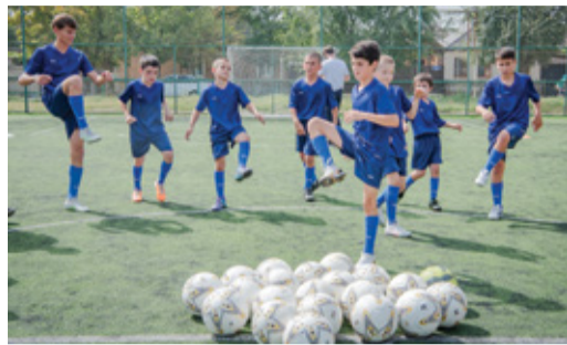
ТАКИЕ НУЖНЫЕ ПОДАРКИ ОТ ГАЗОВИКОВ О благотворительной деятельности предприятия Стр. 4