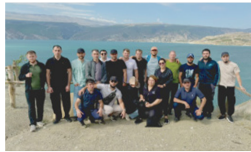
КОЛЛЕКТИВНЫЕ ВЫХОДНЫЕ ИЗБЕРБАШКОГО ФИЛИАЛА Коллеги зарядились позитивом Стр. 7