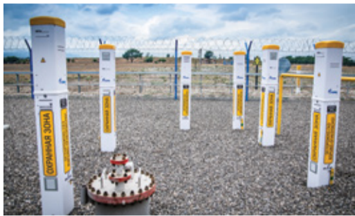
ЕСТЬ ИДЕЯ! ОНИ ДВИГАЮТ ПРОГРЕСС! Подведены итоги конкурса «Лучшее подразделение по рационализаторству» Стр. 3