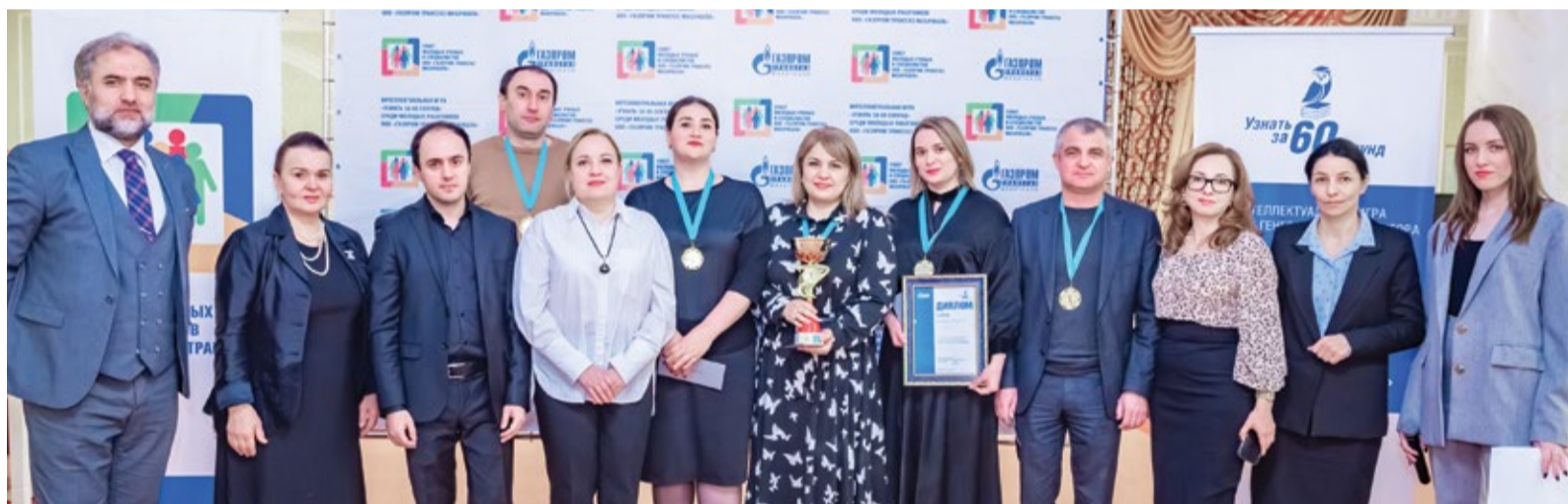
Победитель викторины команда «220 Вольт»

На территории ООО «Газпром трансгаз Махачкала» в конференц-зале «Асиль» 26 декабря состоялась интеллектуальная игра «Узнать за 60 секунд. Союз поколений», организованная совместно ОППО «Газпром трансгаз Махачкала профсоюз» и Советом молодых ученых и специалистов предприятия. В интеллектуальном баттле приняли участие 16 команд, состоявших из представителей всех филиалов Общества.