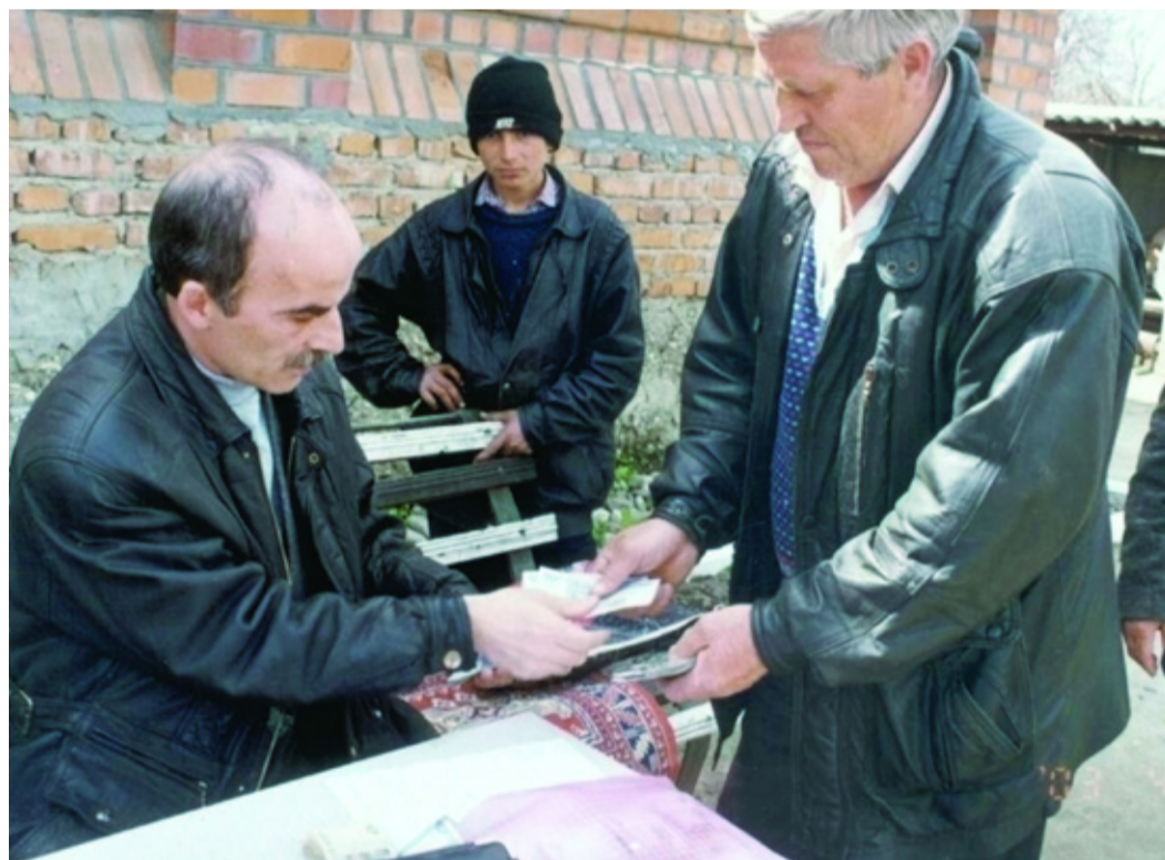
Работники вновь созданного Червленненского ЛПУМГ впервые за несколько лет получают зарплату