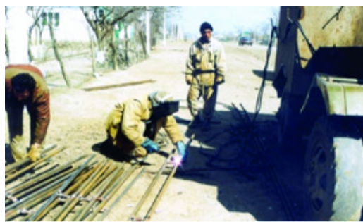
К СОСЕДЯМ – С МИРНЫМ ОГНЕМ... Продолжение материала о помощи Чеченской Республике в 2000-м году Стр. 4