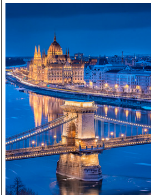
Буданеум.

22 января в режиме видеоконференцсвязи состоялась рабочая встреча Председателя Правления ПАО «Газпром» Алексея Миллера и Министра внешнеэкономических связей и иностранных дел Венгрии Петера Сийярто.