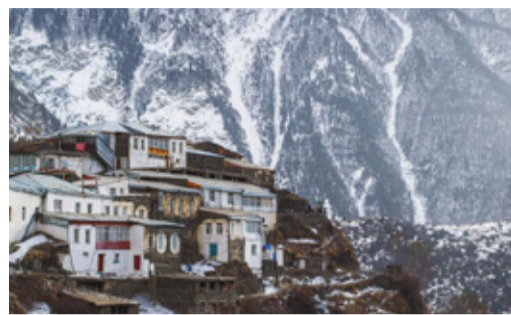
ПРИЕЗЖАЙТЕ В ДАГЕСТАН! Продолжаем открывать красоты Дагестана - Рутульский и Казбековский районы РД Стр. 6