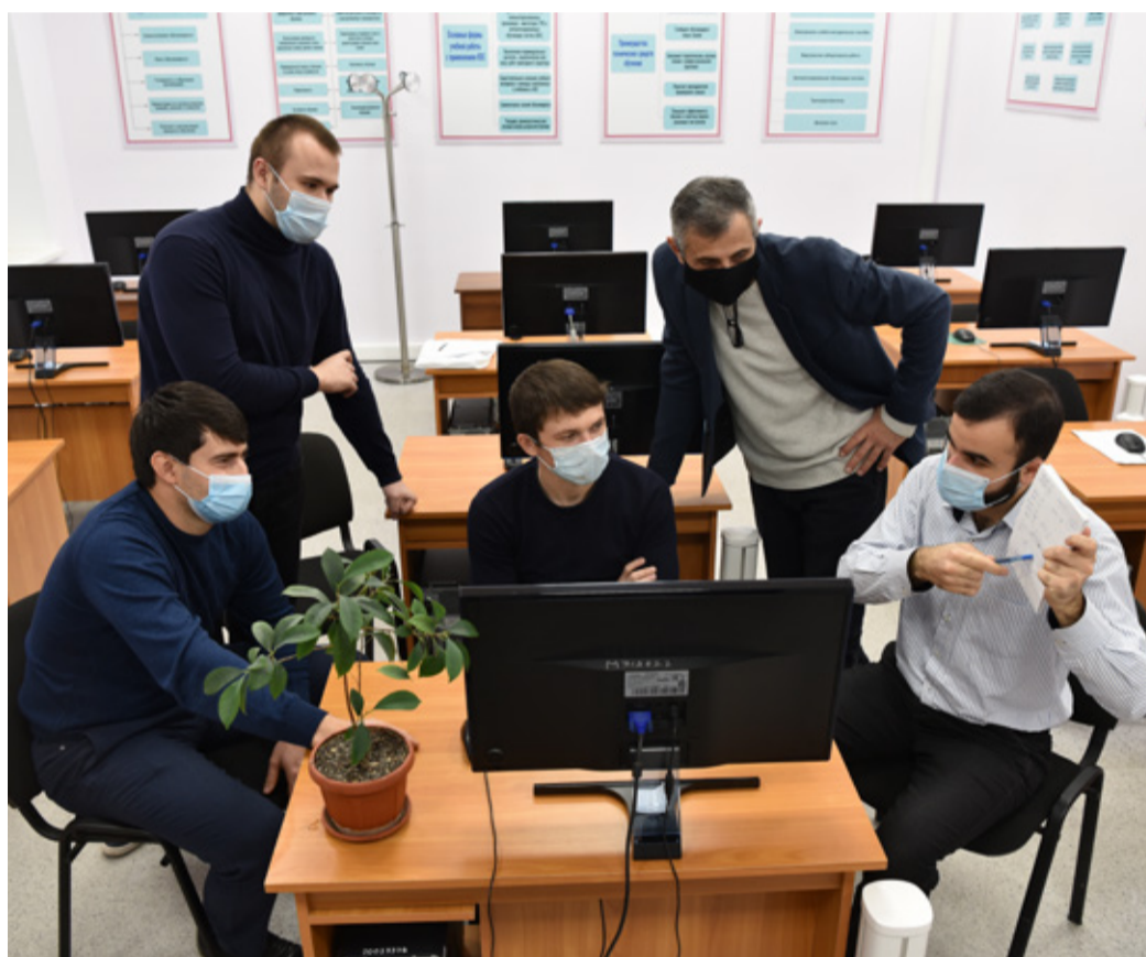
Обсуждение очередного вопроса