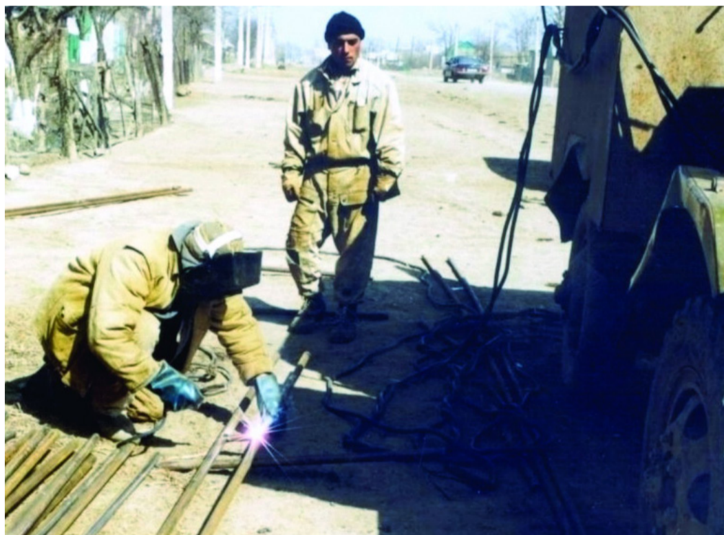
Ведутся ремонтно-восстановительные работы