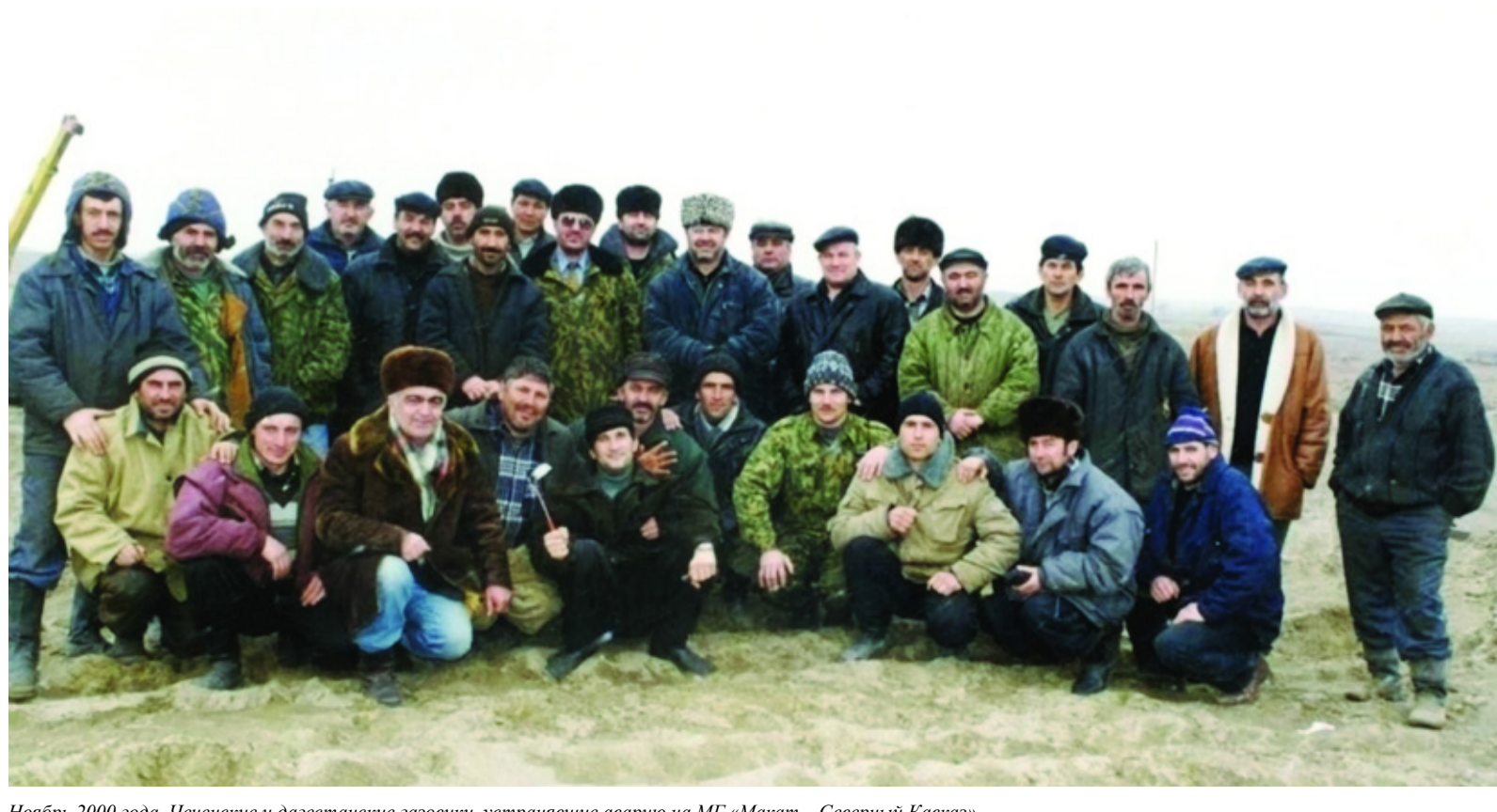
Ноябрь 2000 года. Чеченские и дагестанские газовики, устранявшие аварию на МГ «Магат – Северный Кавказ»