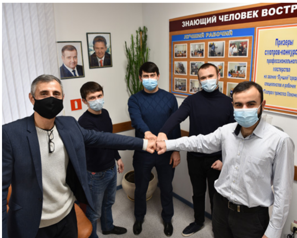
Игроки команды «Порт-Петровск»

собой участники из ООО «Газпром трансгаз Ставрополь» и ООО «Газпром энерго».