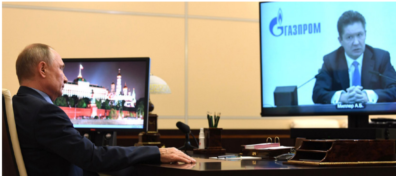
Владимир Путин и Алексей Миллер.

Состоялась рабочая встреча Президента Российской Федерации Владимира Путина и Председателя Правления ПАО «Газпром» Алексея Миллера.