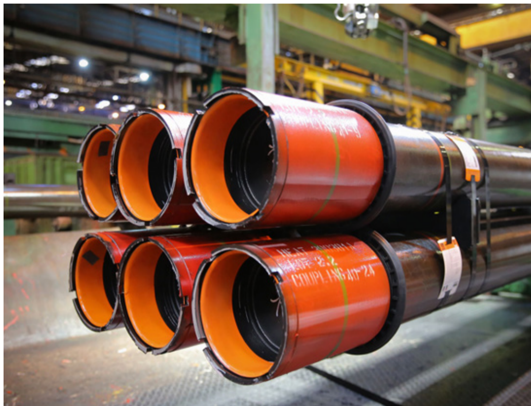
Трубы с резьбовыми соединениями последнего поколения

В целом за последние пять лет благодаря сотрудничеству с «Газпромом» ТМК выполнила комплексные научно-исследовательские и опытно-конструкторские работы, модернизировала производственную базу, освоила выпуск более десяти новых видов трубной продукции. В том числе, это импортозамещающие обсадные и насосно-компрессорные трубы из коррозионностойких хромоникелевых сплавов и стойкой к углеводородной коррозии стали типа 13Cr. При этом производство как самих труб, так и трубной заготовки для них впервые было полностью локализовано