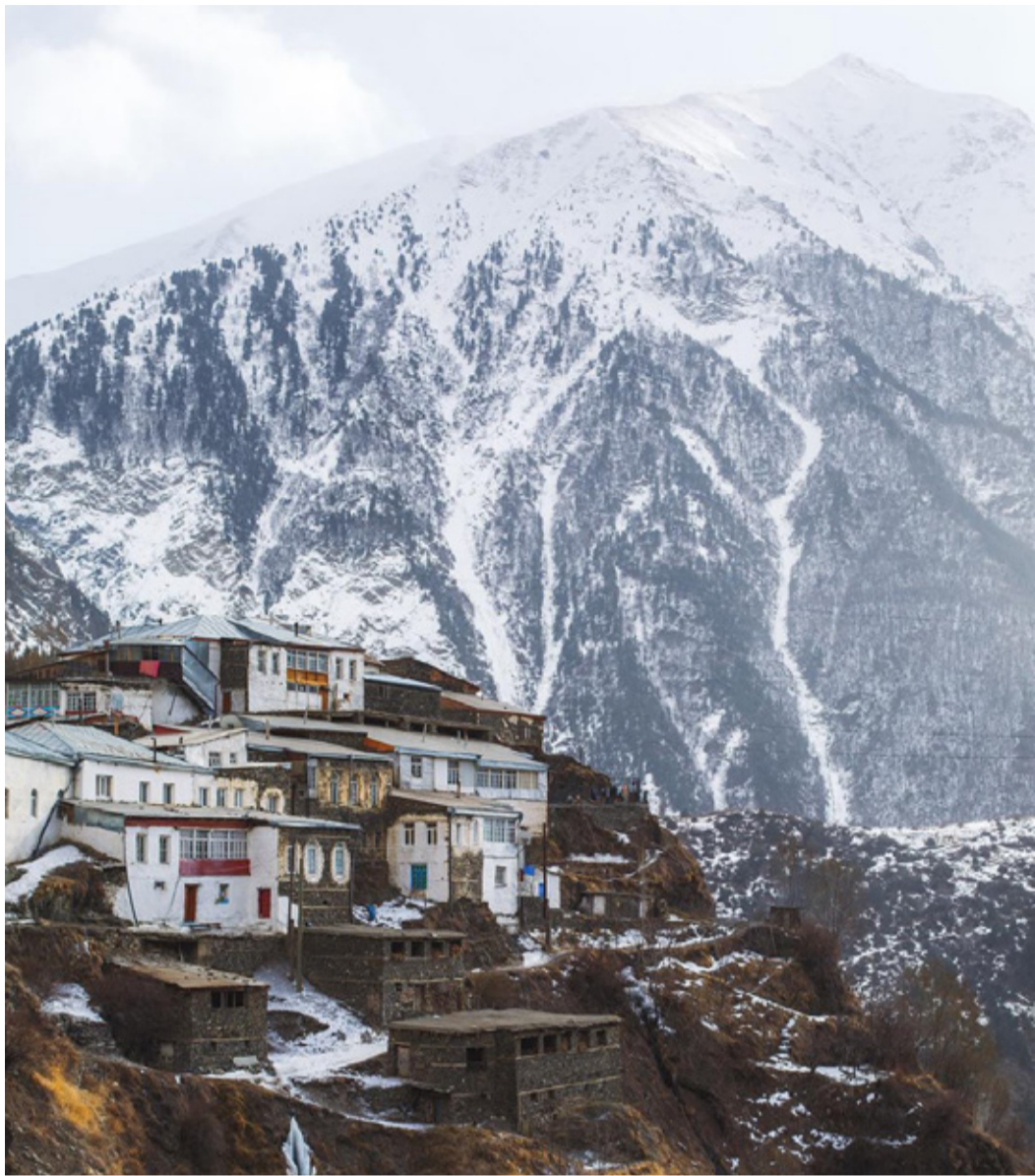
Рутульский район, Село Цахур.

Зима не часто балует Дагестан обильными и длительными снегопадами. В столице республики зимние месяцы бывают преимущественно теплыми, и если все-таки температура воздуха опускается ниже 1-2 градусов, то на пару дней у городских детей наступает невероятно радостная пора катания на санках, игры в снежки и лепки снеговиков.