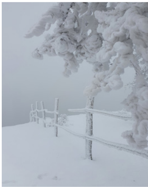
Казбековский район, посёлок Дубки.