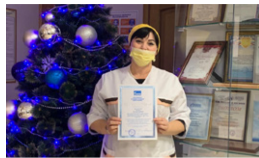
ОТМЕЧЕНЫ ПО ЗАСЛУГАМ Вручены награды МПО «Газпром профсоюз» Стр. 7