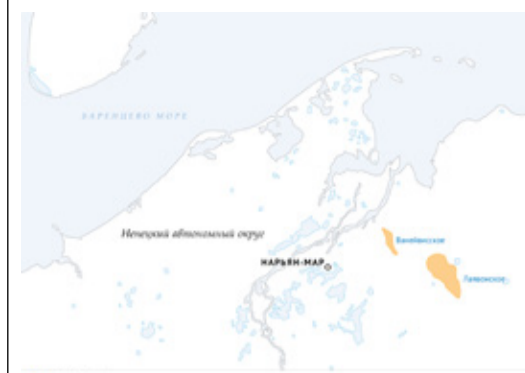
Ванейвисское и Лаявожское месторождения