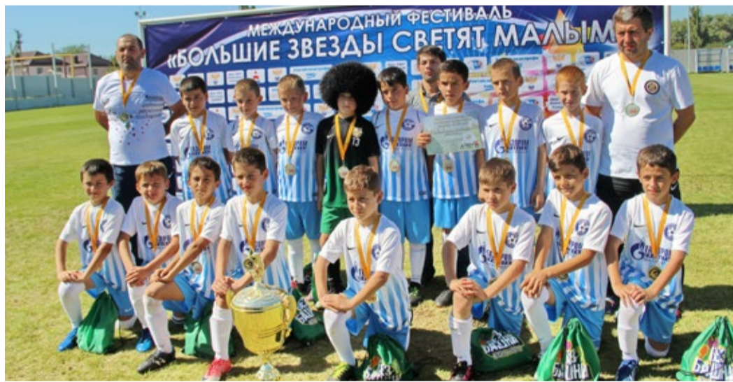
Спортсмены футбольного клуба «Газовик»

Многим в республике и за ее пределами известно не понаслышке о благотворительной деятельности ООО «Газпром трансгаз Махачкала». Ежегодно предприятие оказывает поддержку инвалидам, детям, оставшимся без попечения родителей, советам ветеранов, учреждениям в сфере образования и культуры, и, конечно же, спорт также находится в списке приоритетов на оказание благотворительной помощи.