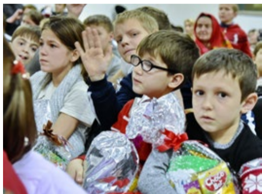
Юные адресаты благотворительной помощи

19 декабря, в преддверии новогодних праздников газовики вновь посетили интернат. Они вручили его воспитанникам спортивный инвентарь, зная, что в учреждении уделяют особое внимание физическому развитию и поддержанию здорового образа жизни подрастающего поколения.