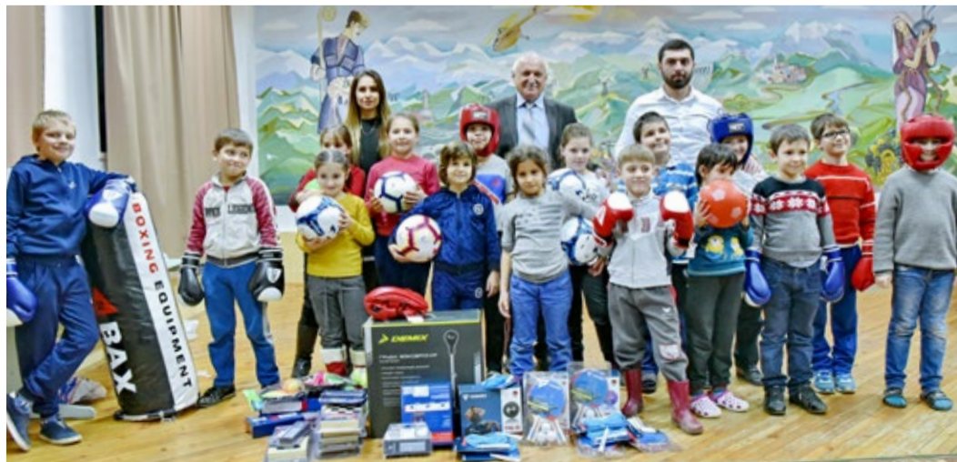
Вручение подарков воспитанникам школы-интерната