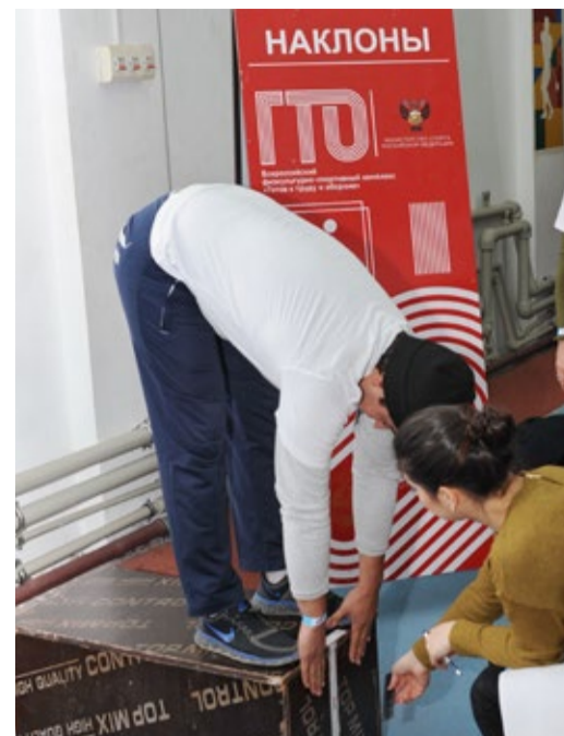
Наклон вперед из положения стоя

В беге на дистанцию в 60 метров газовики продемонстрировали хорошие физические данные, а забег на 3000 метров выявил самых выносливых. Задача бегунов усложнялась тем, что бежать приходилось, преодолевая сильный холодный декабрьский ветер. Лишь немногим удалось пробежать все семь с половиной кругов. К сожалению, многие сходили с дистанции раньше времени.