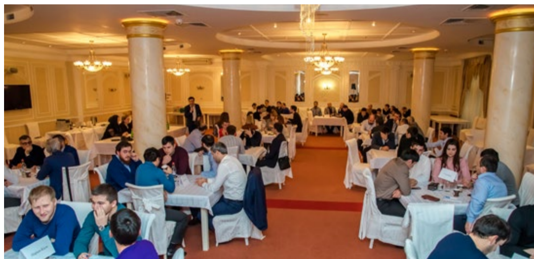
Эрудиты игры «Узнать за 60 секунд»