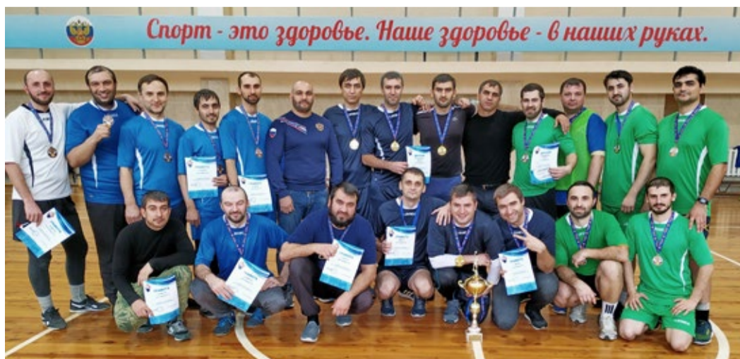
Призеры баскетбольного турнира