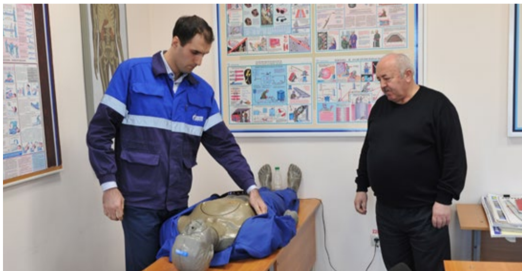
Выполнение практического задания

Ежедневно, пересекая порог родного предприятия, мы вверяем его руководству свою безопасность в процессе трудовой деятельности. Именно предприятие отвечает за создание и поддержание безопасных условий труда каждого из своих работников. Нашей же обязанностью является следование всем необходимым требованиям и правилам, постоянная проверка собственных знаний в области безопасности труда и повышение его уровня.