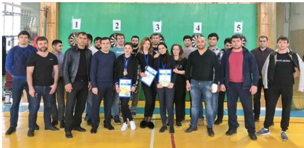
Участники турнира по дартсу

В субботу, 8 декабря, в спортивном зале Медико-санитарной части ООО «Газпром трансгаз Махачкала» состоялся турнир по дартсу среди молодых работников Общества.