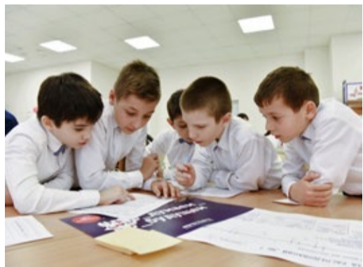
Бурное обсуждение вопроса