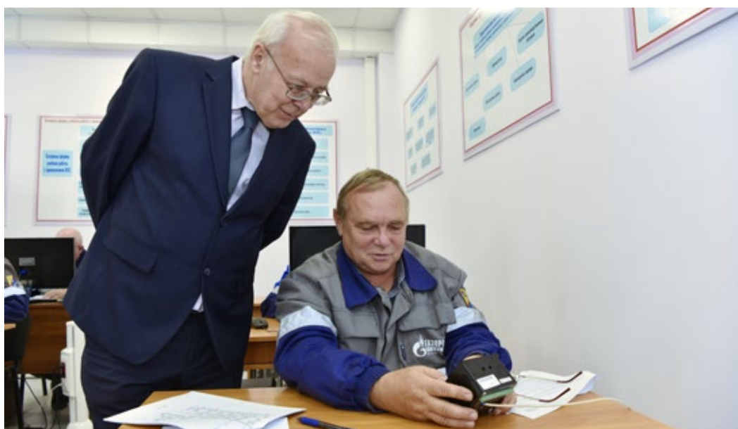
Программирование реле в ходе выполнения практического задания