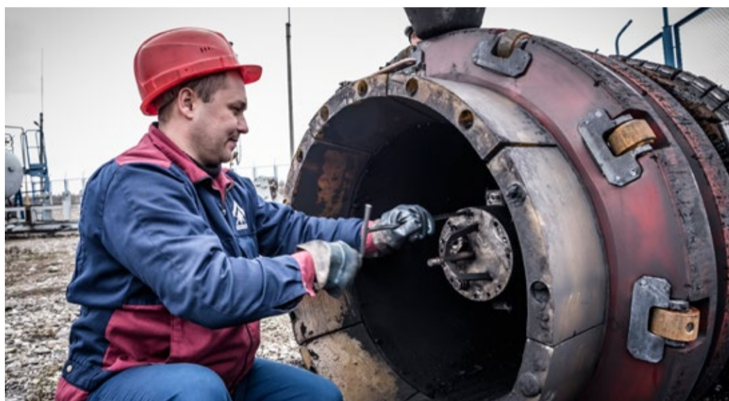
Извлечение электронного блока записи из дефектоскопа