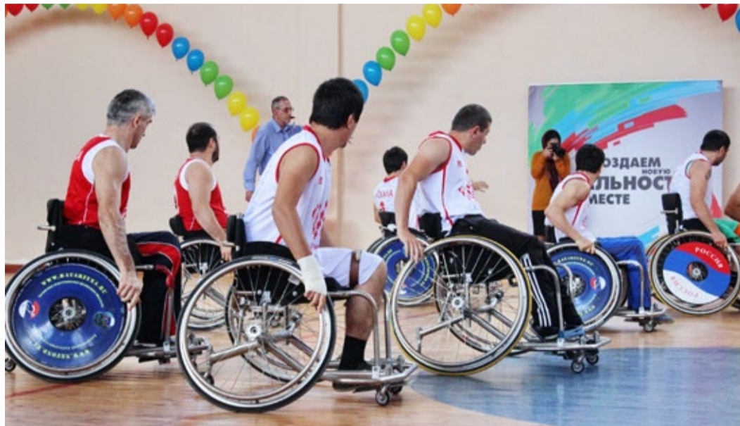
Спортсмены клуба «Скала плюс»