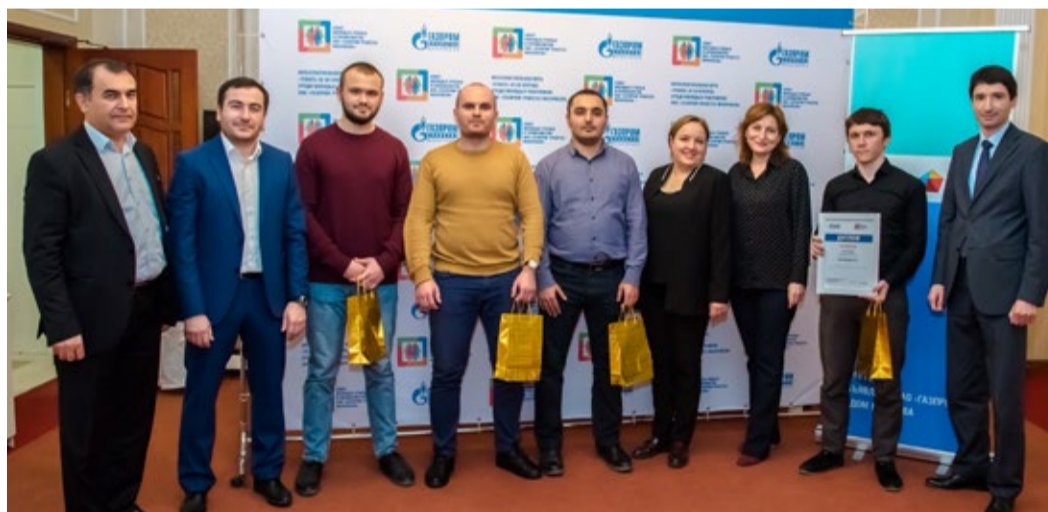
Победители интеллектуальной игры

Вопросы были подготовлены организатором игры из разных областей знаний, на которые в течение 60 секунд участники состязания ума должны были дать ответ. Подсчет правильных ответов вели члены жюри, отмечая их в своей таблице. После заданных первых 10 вопросов наметилась команда-лидер,