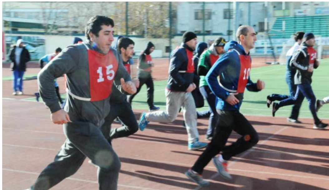
Самые выносливые в забеге на 3000 м

Существует несколько ситуаций, когда взрослые мужчины превращаются в азартных подростков. Одна из них – участие в спортивных состязаниях. Когда парни доказывают себе и всему человечеству, что они сильные, быстрые, выносливые, гибкие и прыгучие, глаза их загораются огнем, они как будто вытягиваются, становятся выше ростом и расправляют плечи, готовые к любым испытаниям, во имя подтверждения высококого уровня своей физической формы.