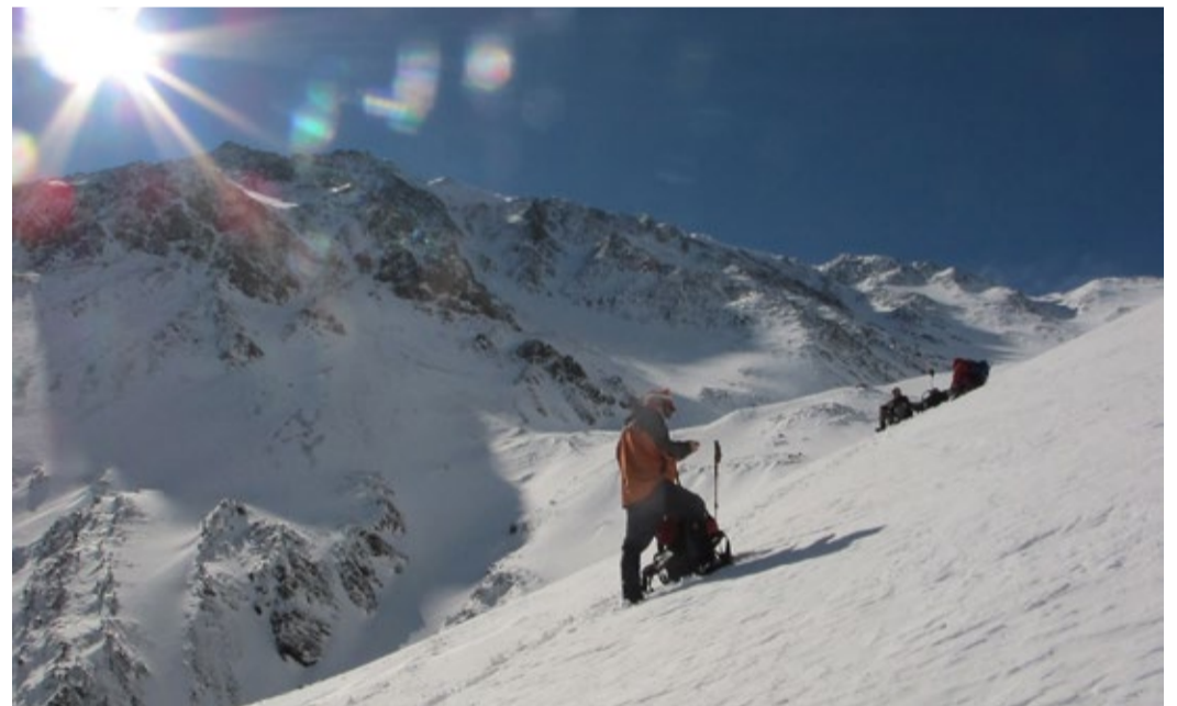
Короткая остановка для связи с базой