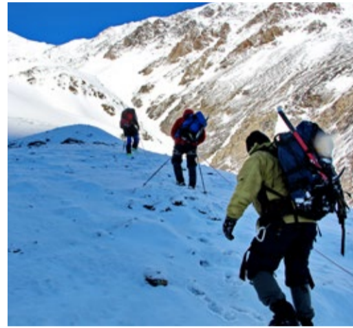
Связанные одной целью