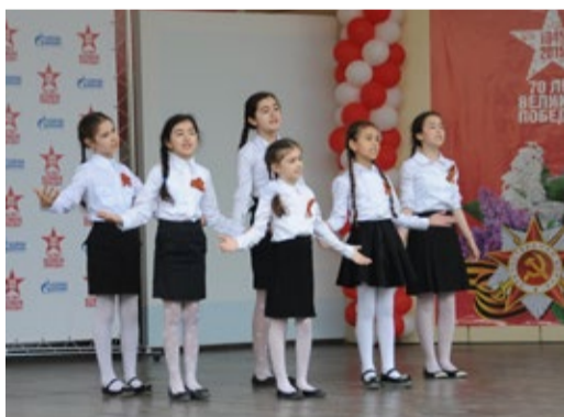
Ансамбль «Жемчужинки» исполняет песню «И все о той войне увидел я во сне»