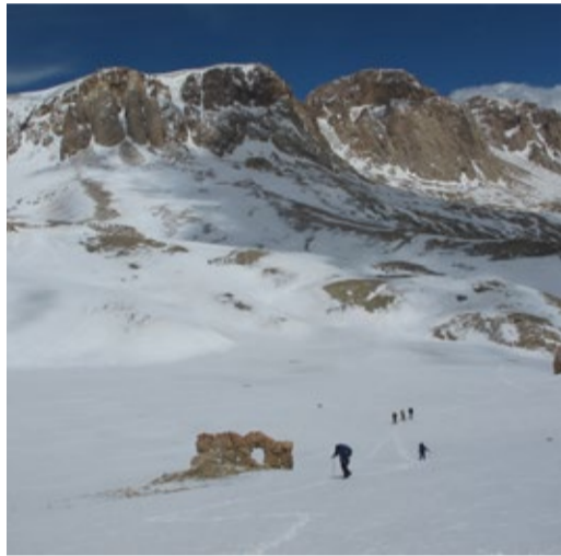
Обходим природную предвершинную триумфальную арку