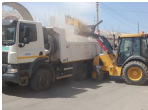
Спецтехника помогает наводить чистоту

ботников ООО «Газпром трансгаз Махачкала» – традиция, которую на предприятии поддерживают и продолжают. Этот субботник – не единственная акция, приуроченная к 70-летию Великой Победы. С начала 2015 года общество проводит встречи с ветеранами, экскурсии для детей сотрудников предприятия в Музей боевой славы, конкурсы детских рисунков и творческих работ, посвященных Великой Отечественной войне, другие мероприятия.