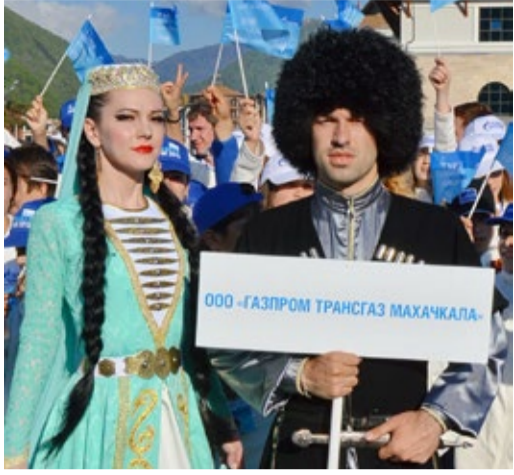
Представители делегации Общества на фестивальной площадке

В Сочи в Красной поляне завершилась трехдневная программа «Факела» – VI-го корпоративного фестиваля самодельных и творческих коллективов и исполнителей дочерних обществ и организаций ОАО «Газпром», объединившая свыше 1700 участников из всех уголков России и дружественных государств.