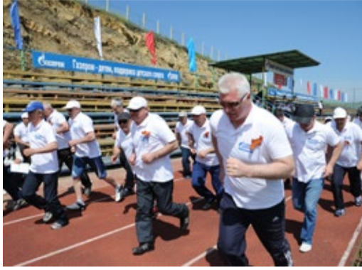
Масс-старт по кроссу

В мероприятии, состоявшемся в спортивном комплексе «Олимп» в с. Карабудакент, приняли участие более 200 работников предприятия в возрасте от 20 до