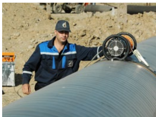
Неразрушающий контроль сварных соединений

4 бригады общей численностью 11 человек участвовали в контроле качества сварных стыков и изоляции при проведении комплекса огневых работ МГ «Моздок – Казимагомед». Проведен контроль качества 38 сварных стыков, 2 технологических отверстий, изоляции.