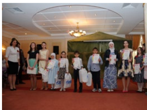
Победители конкурса на лучшее живописное и литературное произведение о Победе