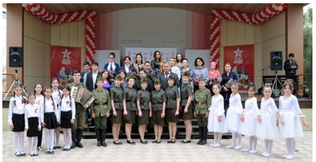
Эту память завещаем мы беречь...