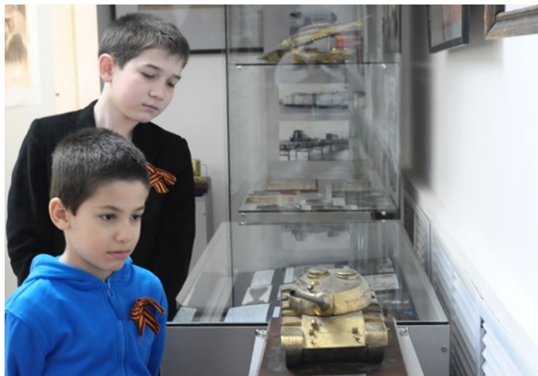
Прототип модели танка Т-34, ставшего легендой великих сражений на полях войны, сразу привлек внимание юных дагестанцев