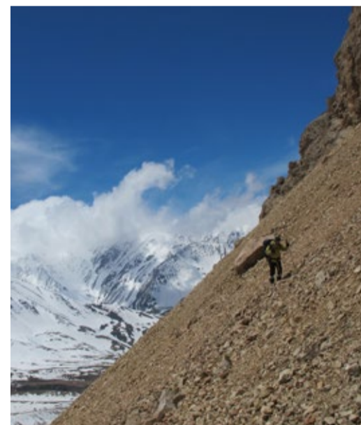
Преодолевая крутую осыпь

ственного скального массива Ерыдаг, самого мощного и высокого на Кавказе. 3670 м над уровнем моря. Вроде немного, но разнообразие препятствий и большой перепад высот (1470 м) от базового лагеря сделали восхождение на ее вершину и спуск с нее достаточно трудными, занявшими весь световой день. И флаг Победы, увенчавший этот день и эту вершину, представлялся нам сейчас и здесь вполне своевременным и уместным.