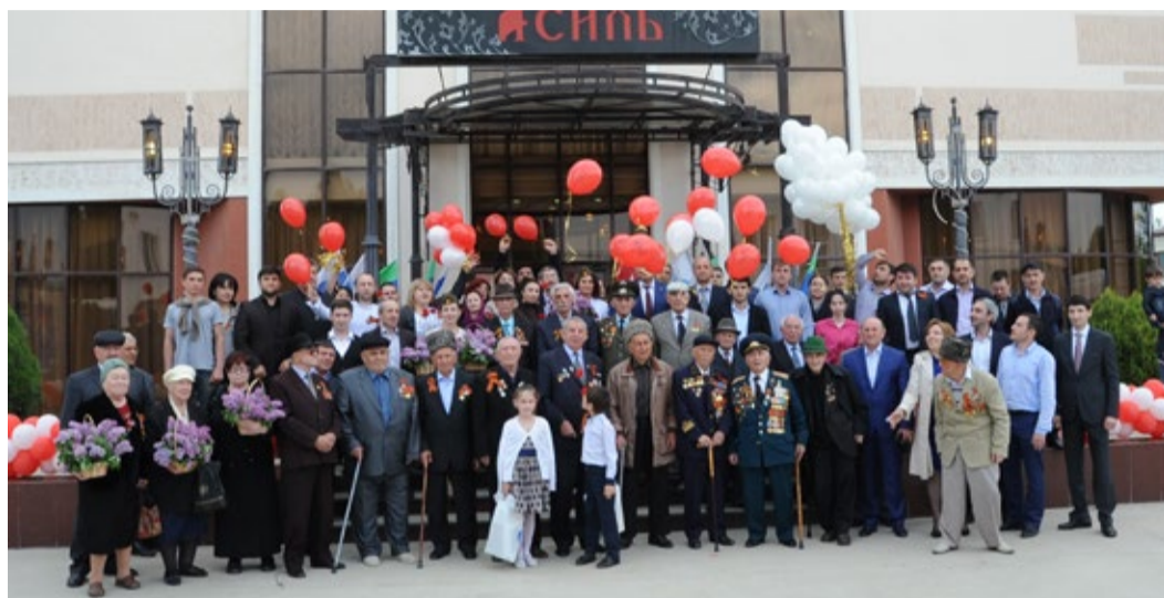
Праздничное фото на память. В первых рядах – доблестные ветераны