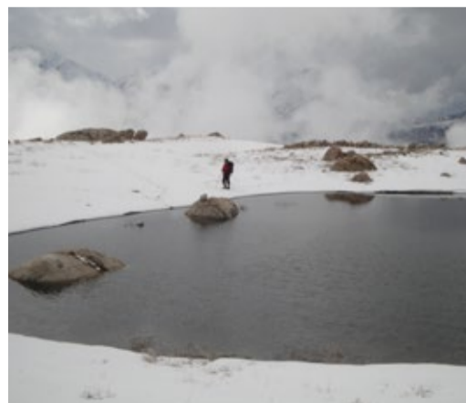
Альпийское озеро под вершиной Сельды

Из-за хронического и практически повсеместного в долине и на большинстве склонов отсутствия связи у всех членов группы мобильники выключены. Соответственно, и будильники. Это, да еще путаница со временем из-за