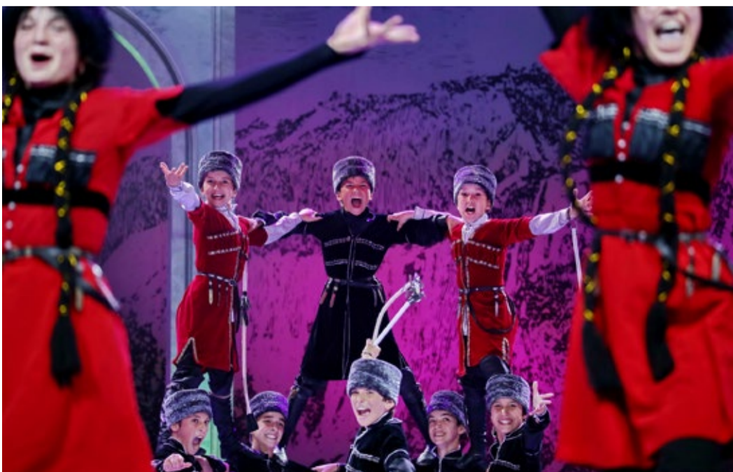
Энергия и красота национального танца Дагестана в исполнении ансамбля «Сари Кум»