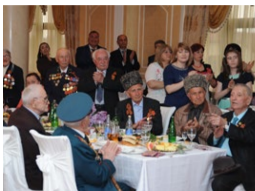
Ветераны Великой Отечественной войны – за праздничным столом