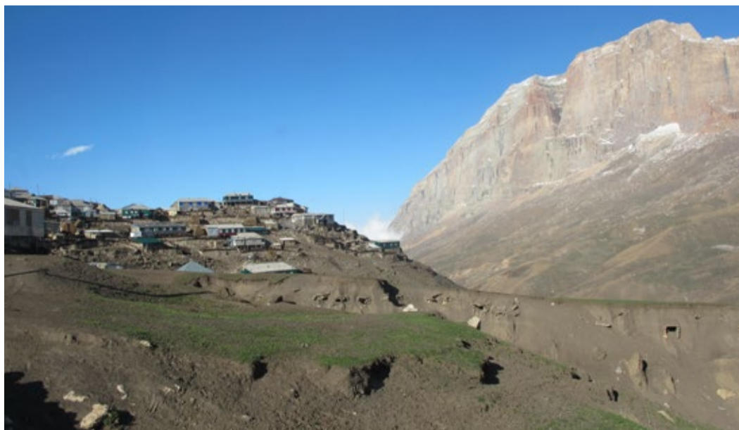
Куруш, массив Ерыдаг и кладбище в разрезе