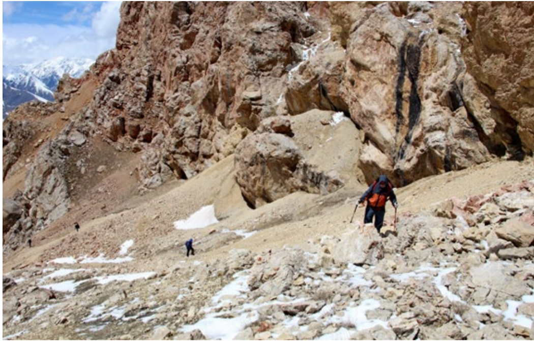
На осыпи под камнями грязь, поверх - местами снег, в конце - скалы