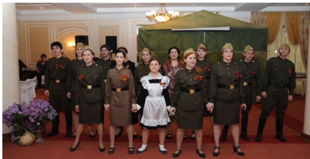
Артисты Дагестанского государственного театра кукол представили постановку «Тебе, Победа, посвящается!»