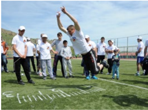
Быстрее, выше, сильнее! И дальше!

Для участников под военно-патриотическую песню «Смуглянка» выступил детский хореографический ансамбль «Сари Кум» – неоднократный лауреат и обладатель Гран-при корпоративного фестиваля ОАО «Газпром» «Факел».