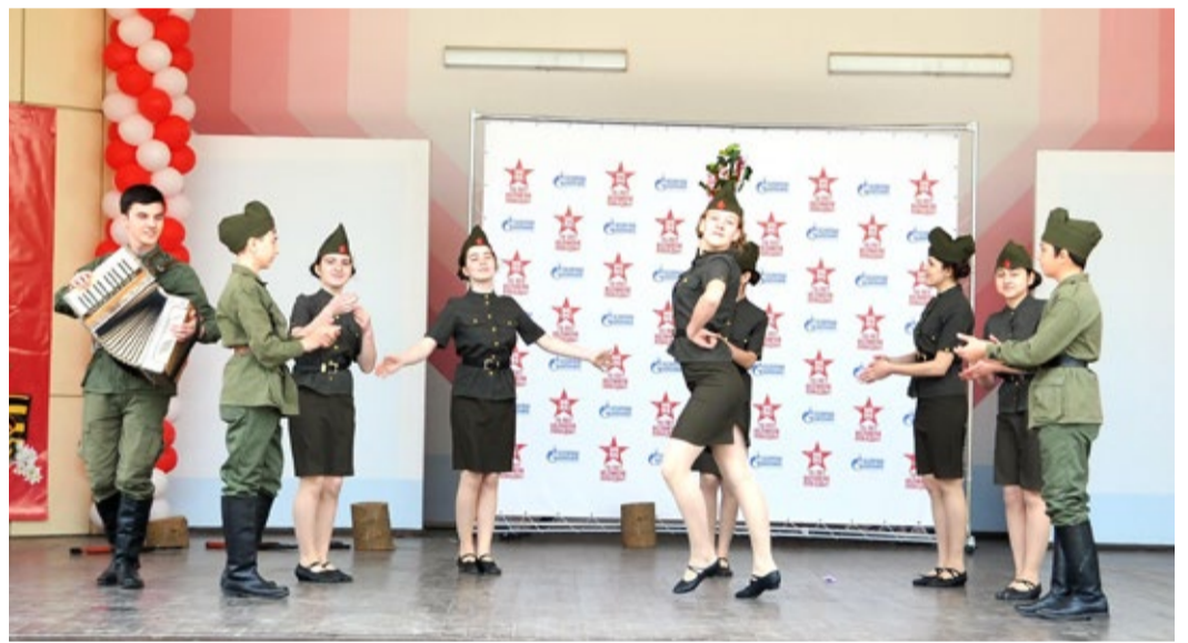
Коллектив «Бабаюрт» исполнил композицию «Катюша»