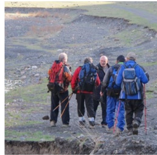
Встреча со старым другом

разницы на час с соседним Азербайджаном, привело к тому, что вышли из лагеря с полу-часовым запозданием. Из альпинистского инвентаря капитаном было указано взять гама-