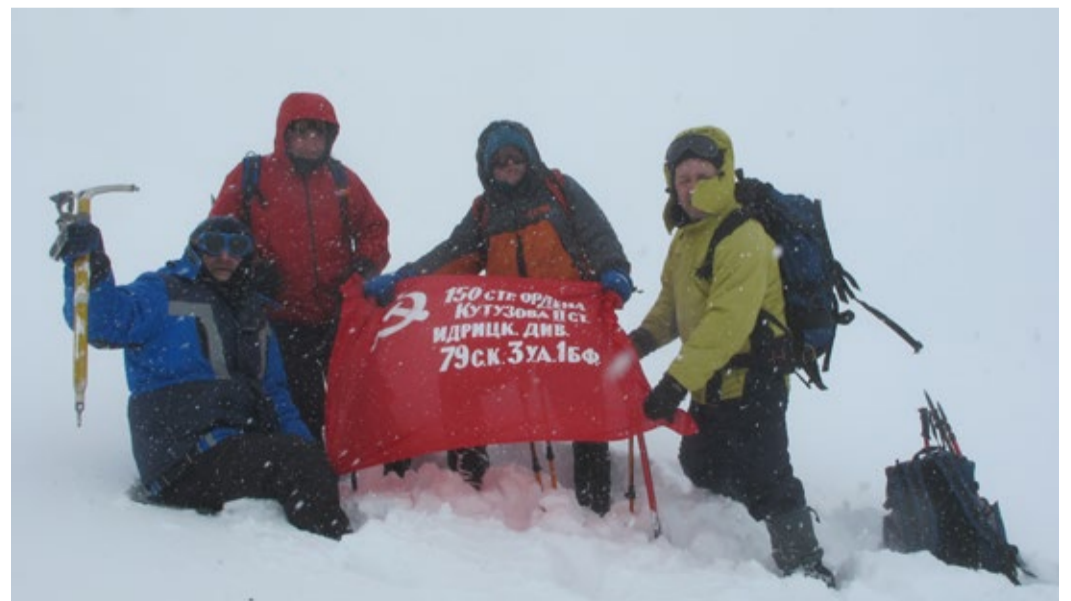
Знамя Победы на перевале Вахчаг

ховки перильную веревку на скалах при выходе из ущелья на склон, на что ушли драгоценные полчаса. Почти весь долгий и крутой, а часто очень крутой, путь от подножия горы до предвершинного гребня глубина снега была по колени и выше. Каждый шаг давался с трудом,