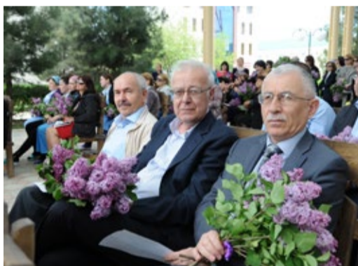
Букеты сирени и улыбки – акция подарила праздничное настроение