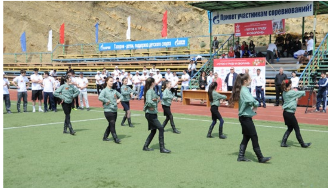
«Смуглянка» в исполнении ансамбля «Сари Кум»