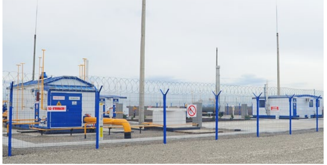
АГРС «Чапаево» после реконструкции, осуществленной в 2014 году

Наше предприятие – ключевое звено в стратегически важном для страны проекте по импорту природного газа из Азербайджанской Республики, в рамках которого в 2014 году получено и транспортировано потребителям более 200 млн куб. м газа.