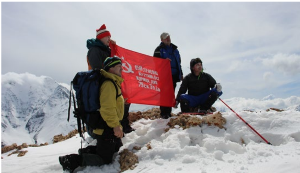
Знамя Победы на вершине Сельды

По графику это был день отдыха. Даже если было бы по-другому, выйти в горы все равно