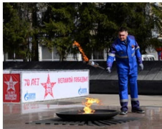
Сытывкар – зажжение Вечного огня на Мемориале Победы после реконструкции

В преддверии 70-летия Великой Победы ОАО «Газпром» реализовало в городах России и Республики Беларусь крупный социальный проект «Священный долг. Вечная па-