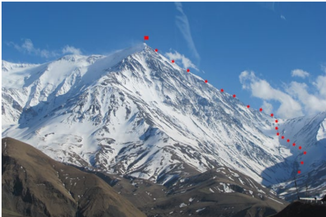
Базардюзю с запланированным маршрутом восхождения