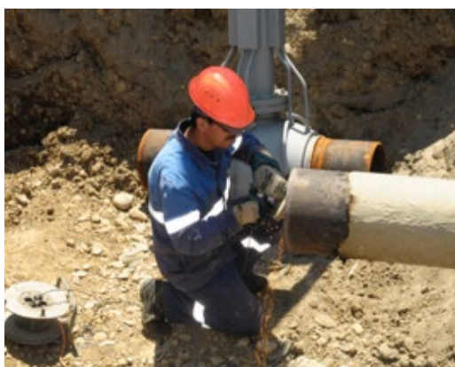
Подготовка стыка трубы для сварки

ООО «Газпром трансгаз Махачкала» в целях повышения надежности функционирования газотранспортной системы осуществляет ее совершенствование и развитие, планомерную реконструкцию, техническое перевооружение и капитальный ремонт.