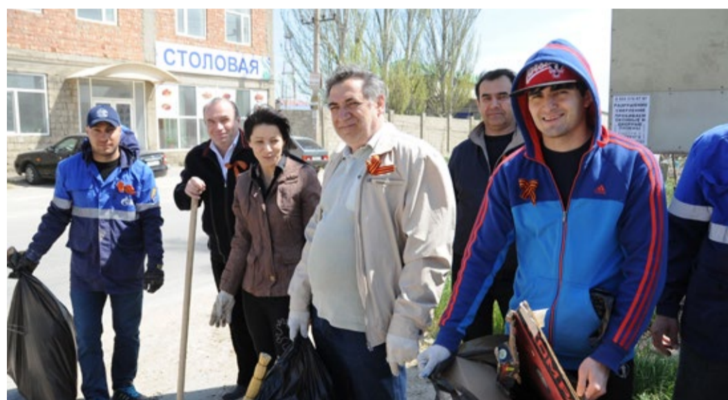
На субботнике – с праздничным настроением

25 апреля состоялся субботник, посвященный 70-летию Великой Победы. В нем уча-