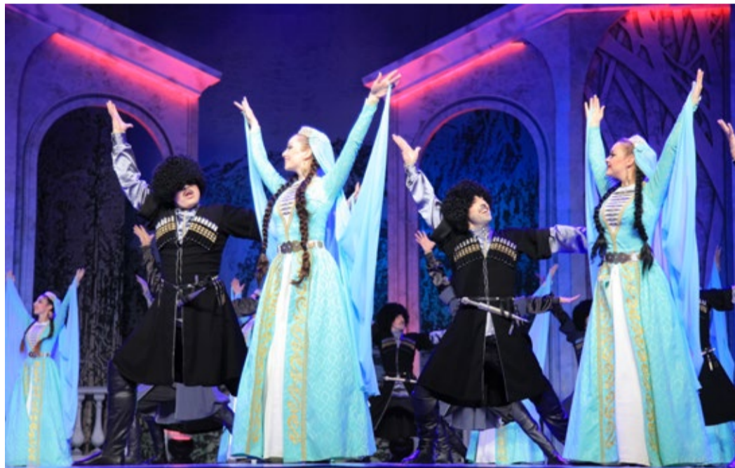
Выступление ансамбля народного танца «Ялын»

В ходе открытия фестиваля участникам и гостям было представлено жюри, которому в эти дни предстояла сложнейшая задача – выбрать лучших из лучших среди большого разнообразия участников. В его состав вошли мэтры современной российской культу-