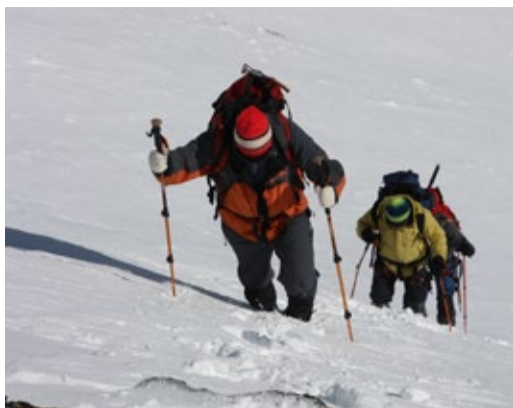
Головы не поднимать...

выдвинулись к лагерю «подскока» (лагерю, с которого осуществляется выход непосредственно на вершину) на перевале Куруш на высоте около 3000 метров. Добравшись до него около 4 пополудни, не без труда из-за силь-