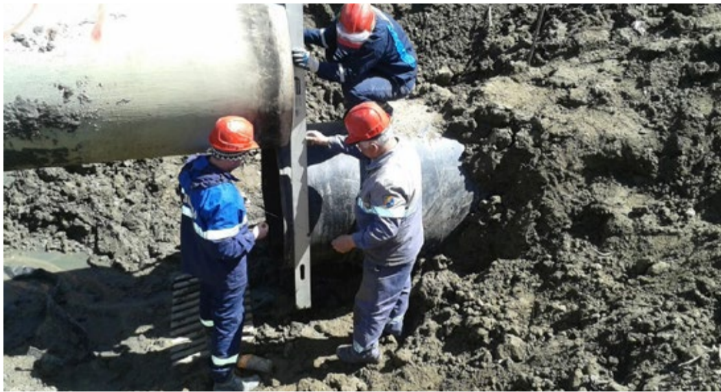
Идет процесс разметки для врезки «катушки»