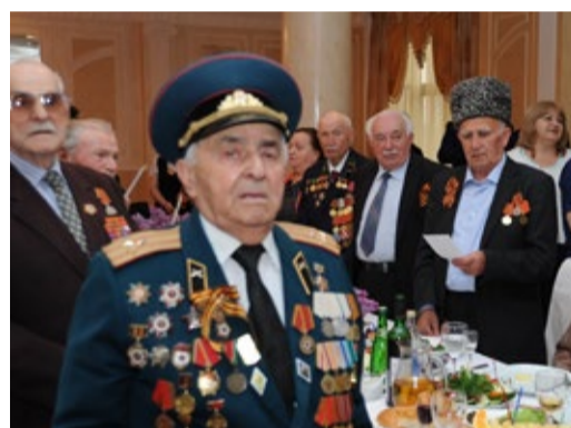
«День Победы» поют все