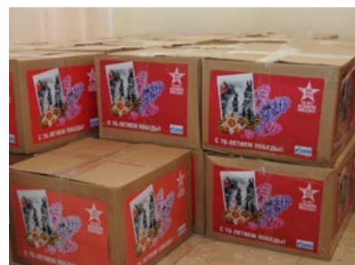
Подарки, приготовленные для ветеранов