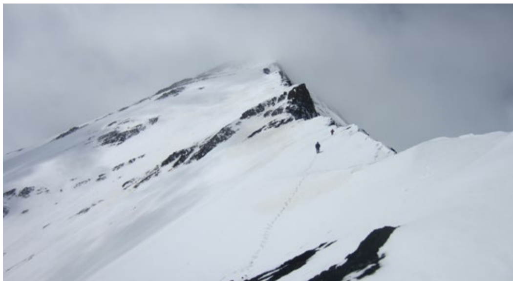
Тропа все опаснее, погода все хуже...

После полудня, примерно в 13 часов, подошли к восточной вершине на высоте около 4200 м. Учитывая сложность следующего небольшого участка маршрута, по указанию опытных инструкторов протянули страховочные веревки. Движение сильно замедлилось и среди участников пошел ропот, что можно