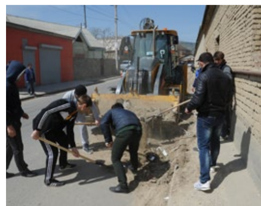
Трудную работу вместе делать веселее

25 апреля состоялся субботник, посвященный 70-летию Великой Победы. В нем уча-