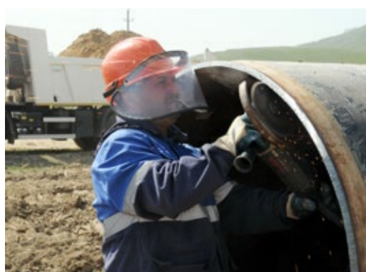
Зачистка среза трубы

Специалистами ИТЦ проведен мониторинг оползневой участка на ГО «Ново-Лидже». Представителями Махачкалинского участка Кавказского Управления «Газпром газнадзор» с 18 по 22 мая проведена плановая проверка технического состояния газопроводов.