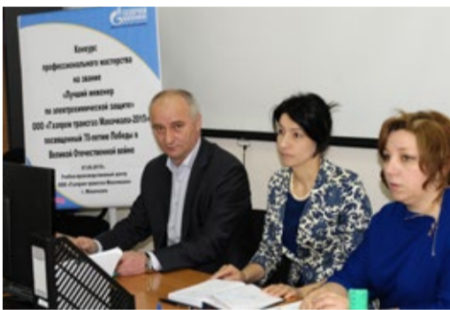
Члены конкурсной комиссии

В целях совершенствования профессионального мастерства специалистов по электрохимической защите 7 мая в Учебно-производственном центре проведен конкурс на звание «Лучший специалист по электрохимической защите – 2015».