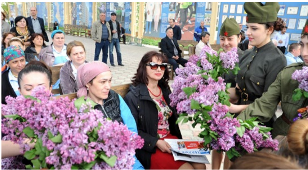
Дети вручили работникам предприятия символы акции – букеты сирени, перевязанные георгиевской ленточкой