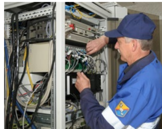
Ремонт блока питания

Выполнено конфигурирование межсетевого экрана для предоставления доступа к порталу «Сбербанк России» с ПК ведущего экономиста финансового отдела.