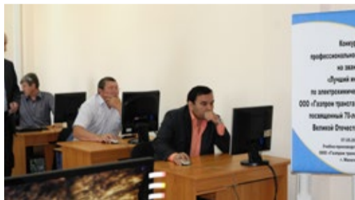
Выполнение теоретического задания